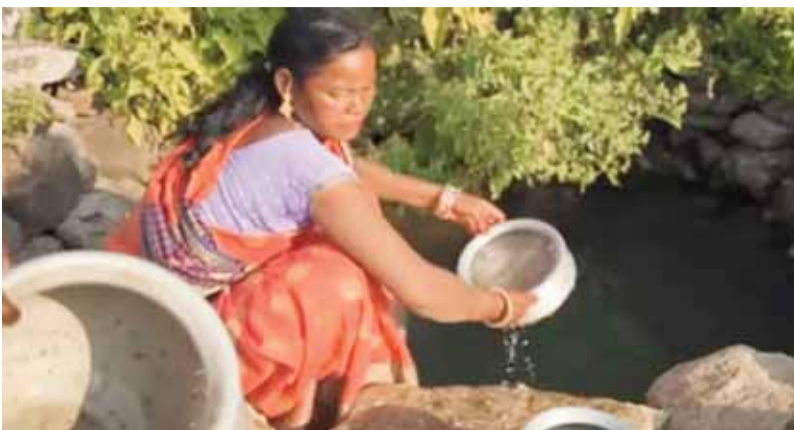
हरिभूमि न्यूज अनूपपुर।

विकास की गाड़ी जब राजधानी से चलती है तो बड़े शहरों में एसी में बैठी मुस्कानें उतरती हैं, लेकिन दादर सिलवारी आते-आते उसके पहिए जैसे जाम हो जाते हैं। यहाँ नल नहीं, नल के वादे हैं... सड़क नहीं, शिला-न्यास की यादें हैं। कहावत है कि “जिसके हाथ में लाठी, उसकी भैंस” और यहाँ लाठी सत्ता के हाथ में है, भैंस विकास की, जो गांव की चौखट तक आने से पहले ही बंधक बन जाती है। प्रशासन के लिए यह गांव शायद नक्शों की गलती है, और जनप्रतिनिधियों के लिए चुनावी भाषण की एक पंक्ति है। “सबका साथ, सबका विकास” यहाँ सुनने में तो अच्छा लगता है, पर जमीन पर यह जुमला उतना ही खोखला है जितना सूखा कुआँ...। दादर सिलवारी आज भी सवाल पूछ रहा है कि क्या संविधान सिर्फ शहरों के लिए लिखा गया था? या गांवों के हिस्से में सिर्फ आश्वासन और प्रतीक्षा आई है?